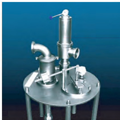
Люки для танков, оснащённые верхушечной арматурой